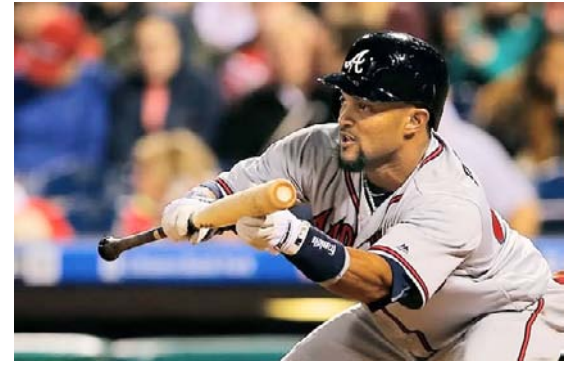
Toque de bola

En la Liga Mexicana del Pacífico, en cambio, el