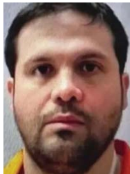
Joaquín Guzmán López