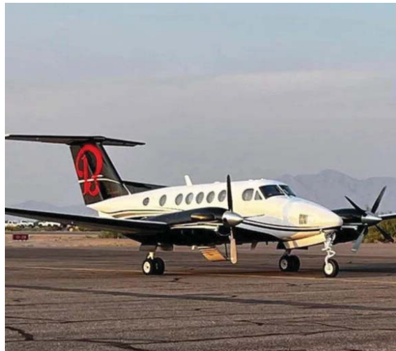
La avioneta de la traición, ahora como pieza de museo

Porque, al final, no hay museo lo suficientemente grande para esconder la historia... ni silencio que dure para siempre cuando la verdad decide despegar.