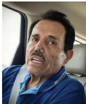
Ismael El Mayo Zambada