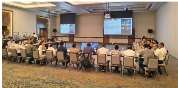
EN PUERTO VALLARTA

Cada aportación representa una muestra de esperanza y apoyo para quienes hoy enfrentan las consecuencias de esta emergencia.