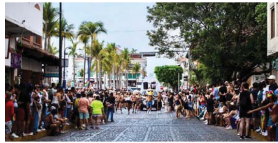
DURANTE MES PRIDE