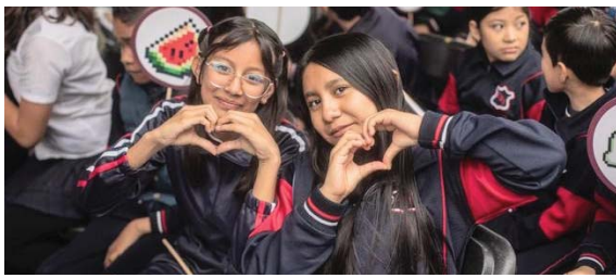
ATENDIÓ A MÁS DE 10 MILLONES DE ESTUDIANTES