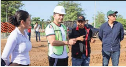
En San José del Valle