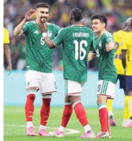
Querer es poder

Ojalá la Selección siga avanzando. Pero ojalá también aprendamos que el verdadero Mundial se juega todos