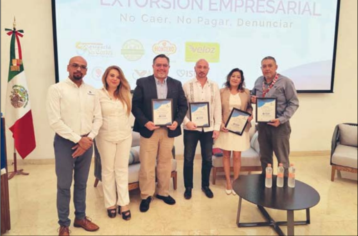
MERIDIANO | PUERTO VALLARTA

La organización subrayó que su presencia en el Comité de Adquisiciones tiene como finalidad aportar una visión técnica, objetiva y ciudadana, aclarando que su intervención no implica facultades para fiscalizar, investigar o sancionar las decisiones de la administración pública