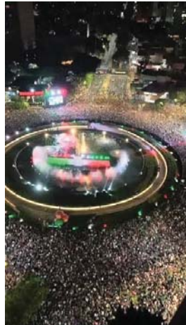
La Minerva está llorando