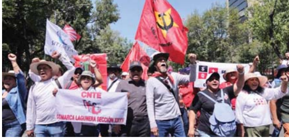
Los maestros de la CNTE, bien forrados de dinero