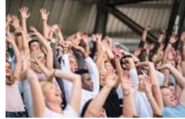
La ola nacional

brazo. No obtuvieron el incremento salarial del cien por ciento que exigían, pero tampoco regresaron con las manos vacías. Y como buen pato que termina empataado, ya avisaron que habrá tiempo de revancha.