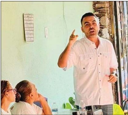
Con recorridos permanentes en Puerto Vallarta