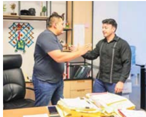
Ayuntamiento, convencido de que escuchar, coordinar esfuerzos y fortalecer el desempeño institucional permite ofrecer mejores resultados a la población.

Asimismo, reiteró que su gobierno mantendrá una política de cercanía con el personal del H. XII