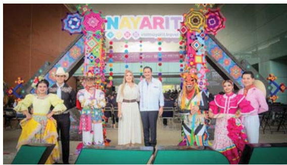
CON APOYO DE LA ONU