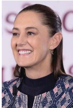
Claudia Sheinbaum Pardo