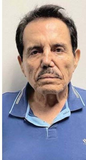
Ismael El Mayo Zambada