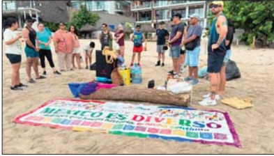
Con la adopción de un espacio público