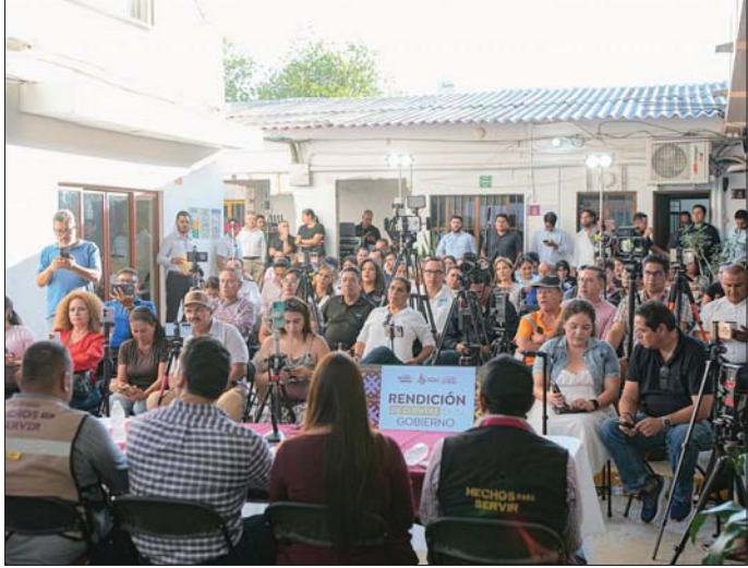
MERIDIANO BAHÍA DE BANDERAS

En materia de regularización, se informó que cinco polígonos ya han sido autorizados, beneficiando a alrededor de mil 50 familias