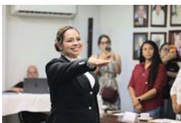
Finalmente, se informó que en los próximos días se dará a conocer a la persona que asumirá la Dirección de Medio Ambiente.

La designación forma parte de los ajustes estratégicos del gobierno municipal para consolidar un equipo sólido, con capacidad de respuesta y enfoque en resultados.