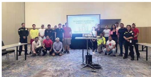
DE CARA A LAS VACACIONES

Municipales de la Unidad Municipal Administrativa (UMA). Las personas interesadas pueden registrarse y solicitar información a través de los números de WhatsApp 322 132 9079 y 322 137 7960.