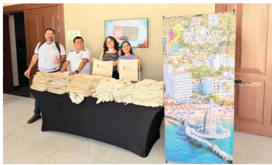
ES LA VIGÉSIMO QUINTA EDICIÓN