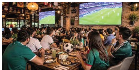
PARA QUIENES ASISTAN AL ESPERADO TORNEO