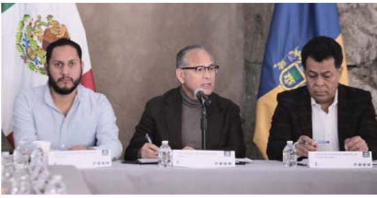
PESE AL INICIO DE LLUVIAS