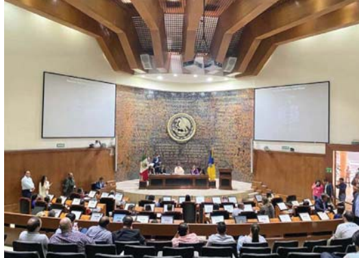
Congreso de Jalisco. La votación que lo decide todo

Porque cuando una morenista acusa a los morenistas de no ser suficientemente morenistas, uno entiende que las víboras no siempre vienen de enfrente. A veces salen del mismo nido.