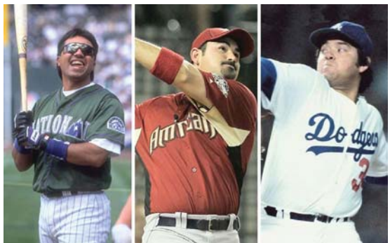
Los mexicanos que han participado en el Juego de Estrellas de la MLB