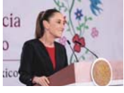
La Presidenta de México, Claudia Sheinbaum Pardo, informó que enviará al Congreso de la Unión una propuesta de reforma a la Ley General de Instituciones y Procedimientos Electorales.

La Presidenta de México, Claudia Sheinbaum Pardo, informó que enviará al Congreso de la Unión una propuesta de reforma a la Ley General de Instituciones y Procedimientos Electorales. El proyecto plantea la creación de la Comisión de Verificación de Integridad de Candidaturas en el Instituto Nacional Electoral (INE), con el fin de evitar la postulación de personas vinculadas con la delincuencia organizada en cualquier fuerza política.