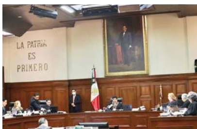
El escenario de la Suprema Corte de Justicia