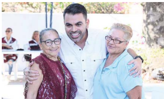
IMPARNABLE EN VALLARTA