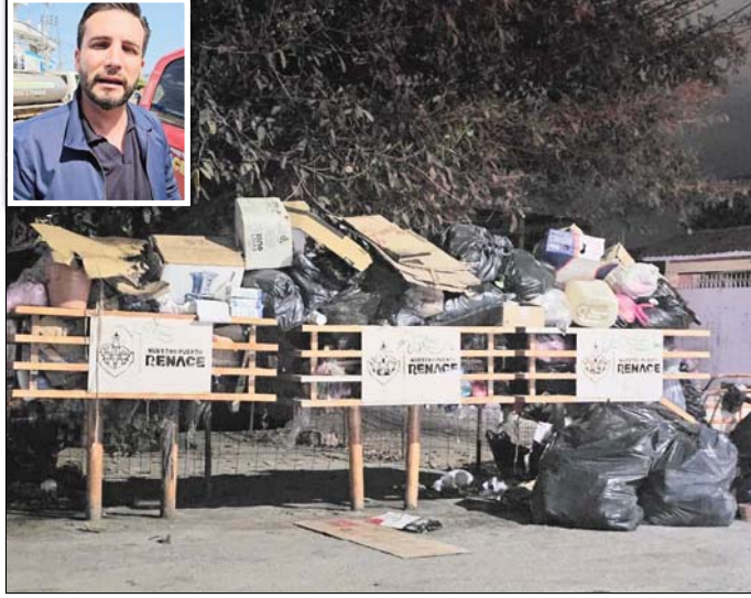
MERIDIANO PUERTO VALLARTA

A pesar de los negativos resultados, la falta