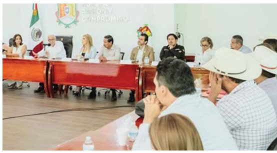
ACTIVAN PROTOCOLOS DE EMERGENCIA