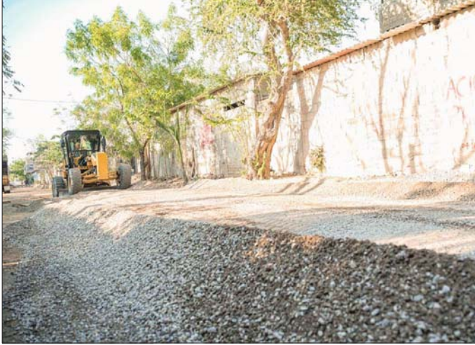
MERIDIANO | BAHÍA DE BANDERAS

Durante los recorridos, autoridades municipales han estado en vigilancia constante del avance de esta obra