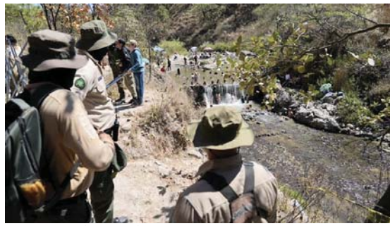
DURANTE LA SEMANA SANTA