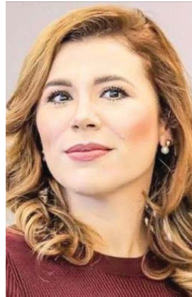
Marina del Pilar Ávila