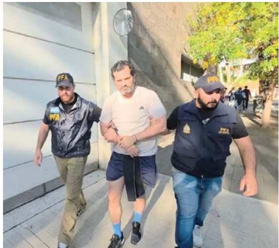
Fernando fue detenido en Argentina y con él se pueden caer muchas otras piezas del ajedrez político