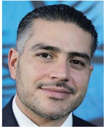
Omar García Harfuch

Este expediente tiene mucha tela de dónde jalar y varios nombres que podrían empezar a sudar frío. Por lo pronto, vayan comprando palomitas, porque el espectáculo apenas empieza. Y ya lo decía la sabia sentencia nacional: entre políticos te veas... y ojalá no te toque declarar.