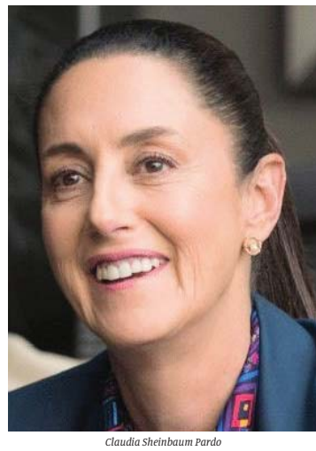
Claudia Sheinbaum Pardo