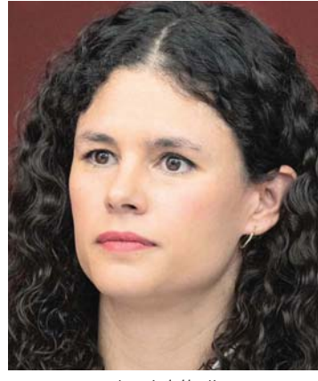
Luisa María Alcalde Luján

Así que, queridos morenistas vallartenses, agarren número y siéntense derechos en la sala de espera. Porque en esto de las candidaturas, unos ganan, otros pierden... y otros descubren demasiado tarde que nunca estuvieron invitados. En fin pues... quietos los pescados.