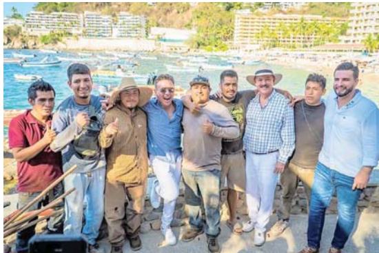
La del recuerdo para los compas, en la obra recién inaugurada