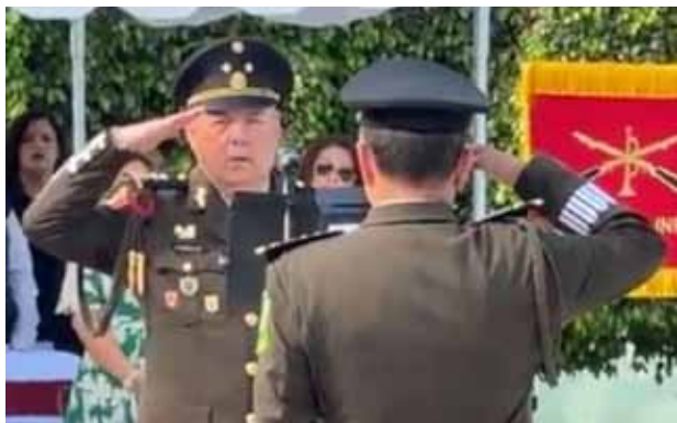
Por Adrián De los Santos MERIDIANO/Puerto Vallarta

*Este viernes fue presentado en las instalaciones de la 41/a Zona Militar a donde asistieron autoridades de todos los niveles de gobierno