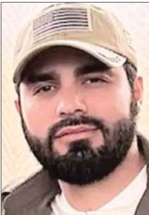
Dámaso López El Mini Lic