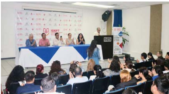
En Puerto Vallarta