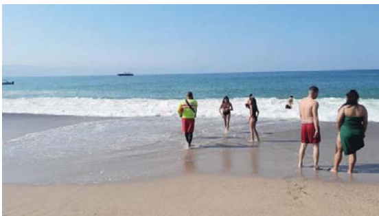
En Puerto Vallarta