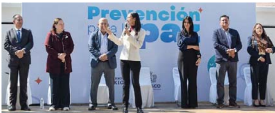
MERIDIANO | Jalisco

La Secundaria Técnica #121, en San Pedro Tlaquepaque, fue sede del primer ejercicio del año que atendió a 700 estudiantes bajo un enfoque de seguridad y cultura de la legalidad