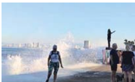
MERIDIANO | Puerto Vallarta

De acuerdo con el reporte oficial, en la zona sur de la ciudad ya se han registrado olas de hasta 1.50 metros, aunque se anticipa un aumento gradual del oleaje provocado por un efecto norte