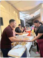
MERIDIANO | Puerto Vallarta

Miles de personas abarrotaron la celebración de la Candelaria, reafirmando la fuerza territorial con aliados que quieren un cambio