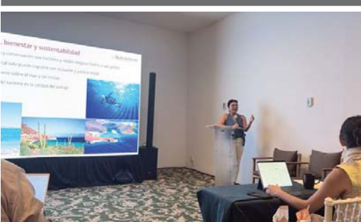
Y ecosistemas costeros