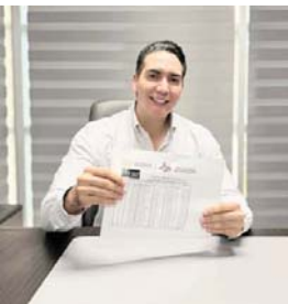
El gobierno municipal mantendrá la gestión para que la inversión se traduzca en oportunidades reales para la juventud bahiábanderense.

Reconoció avances, pero subrayó que Bahía de Banderas "merece más" en beneficio directo al sector estudiantil.