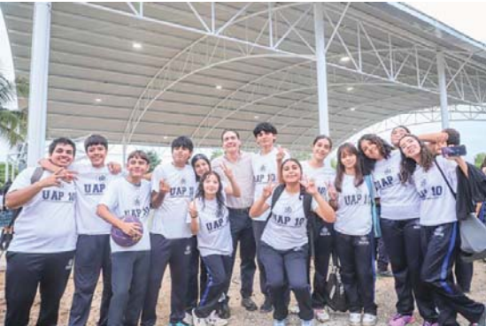
Para Bahía de Banderas