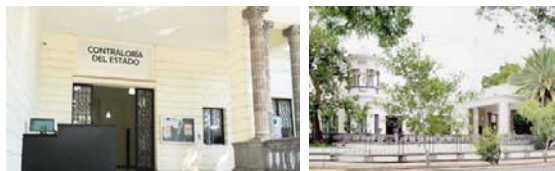
Lanzarán monitor público