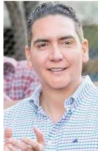
Héctor Santana García

Pero de regreso a Bahía de Banderas, Nayarit, la medida ha generado opiniones encontradas entre la población y los propios miembros de la policía. Algunos sectores sostienen que el presidente municipal Santana García con este tipo de acciones se pensaría que pone a sus elementos que salieron intoxicados en sus exámenes de detección de sustancias ilícitas en manos de la delincuencia, al dejarlos sin empleo y con la experiencia y conocimientos que adquirieron durante su servicio en la corporación. Sin embargo, las autoridades argumentan que esta perspectiva no considera la gravedad del incumplimiento: los policías en cuestión no solo violaron las normas internas de la institución, sino que también pusieron en riesgo la seguridad de la comunidad al ejercer su función estando bajo la influencia de sustancias prohibidas.