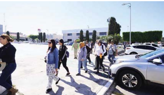
Sin hallazgos hasta el momento