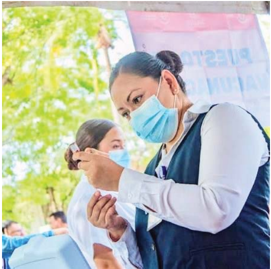
Los módulos de vacunación

El sarampión no conoce de fronteras, ni de clases sociales, ni de edades —solo aprovecha la falta de preparación y la negligencia para extenderse. Es hora de dejar de lado las excusas y tomar conciencia: vacunarse no es solo un derecho sino una responsabilidad que tenemos con nosotros mismos, con nuestras familias y con toda la comunidad. Puerto Vallarta y Jalisco deben estar listos para recibir al mundo en las mejores condiciones, y la salud pública es el primer paso para lograrlo.