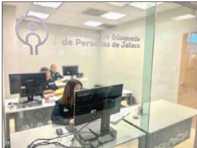
En Puerto Vallarta