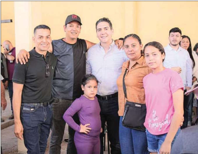
MERIDIANO | Bahía de Banderas

El presidente municipal de Bahía de Banderas realizó una nueva Audiencia Ciudadana en esta localidad, en la que escuchó de viva voz la necesidad de los pobladores