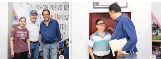
IDEFT Y CORDICA 21