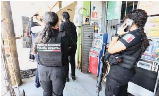
MERIDIANO | Jalisco

La estrategia inició en el Mercado de Abastos, en Guadalajara, y tiene por objetivo alertar a la población de ofertas laborales engañosas