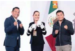
MERIDIANO | Ciudad de México

Este nuevo programa permitirá a 5 mil boxeadoras y boxeadores impartir clases de este deporte a cerca de 100 mil niñas, niños y jóvenes de entre 6 y 29 años de edad