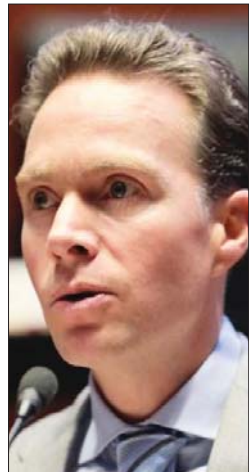
Manuel Velasco Coello