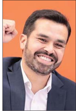
Manuel Álvarez Maynez