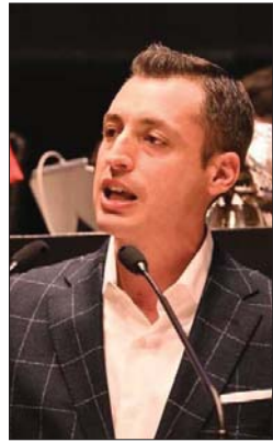
Luis Donaldo Colosio Riojas

A pesar de la postura pública de la Presidenta Claudia Sheinbaum en contra del "nepotismo electoral", el senador Manuel Velasco Coello, coordinador del Partido Verde Ecologista de México (PVEM), ha generado controversia al expresar su respaldo a la senadora Ruth González Silva como posible candidata a la gubernatura de San Luis Potosí. La situación se torna delicada dado que González Silva es la esposa del actual gobernador del estado.