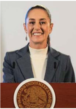
MERIDIANO | Ciudad de México

La presidenta de México, Claudia Sheinbaum Pardo, afirmó que la cooperación bilateral con Estados Unidos en materia de seguridad “va muy bien”, luego de la conversación telefónica que sostuvo esta mañana con el presidente Donald Trump. Durante su conferencia matutina en Palacio Nacional, la mandataria señaló que el diálogo entre ambos gobiernos se mantiene abierto y en marcha, tanto en temas de seguridad como en la revisión del Tratado entre México, Estados Unidos y Canadá (T-MEC), aunque aclaró que aún no existen acuerdos concretos que puedan hacerse públicos. Sheinbaum explicó que esta llamada, realizada a iniciativa del mandatario estadounidense como seguimiento de conversaciones previas, se desarrolló en un tono cordial y permitió