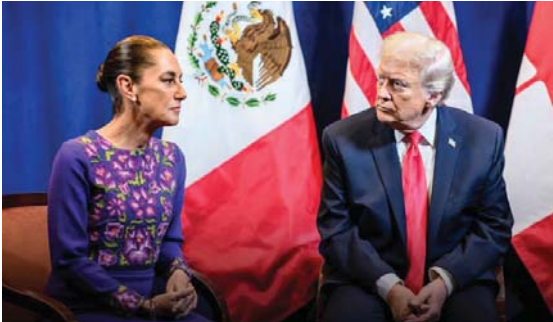
MERIDIANO | Estados Unidos

El presidente de EEUU detalló que durante la llamada se abordaron temas clave como la seguridad en la frontera, el combate al narcotráfico y los asuntos comerciales entre ambos países