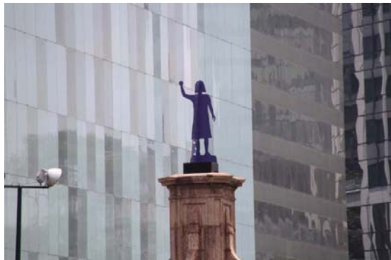
Se dispara en zonas urbanas

tiempo que expresó que los mexicanos “deberían estar muy contentos” con su presidenta.