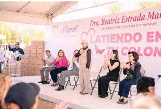
Con las giras Latiendo en tu colonia