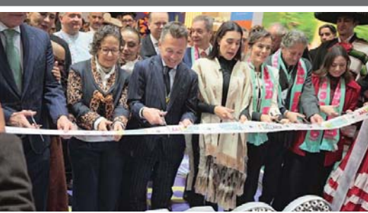
En la Feria Internacional de Turismo

Se espera que antes de que concluya la semana exista un posicionamiento oficial sobre esta problemática, mientras que de manera provisional algunos camiones de Red Ambiental, junto con unidades del propio municipio, se encuentran realizando labores parciales para atender la recolección de residuos en la ciudad.