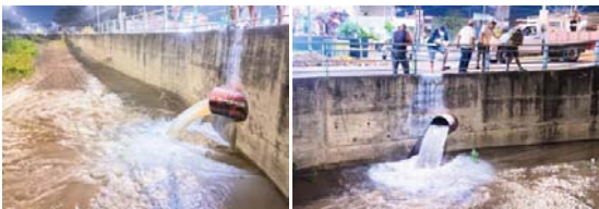
En red de agua potable

Previo al inicio de la Caravana de la Mujer se llevará a cabo un Clase de Zumba en punto de las 8:00 a.m. la invitación es abierta para todas las mujeres del municipio, las esperamos.