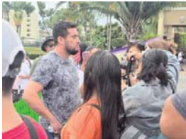
Milton Colmenares /Meridiano Puerto Vallarta

Ciudadanos de Puerto Vallarta lanzaron una nueva convocatoria para realizar una manifestación multitudinaria el próximo viernes 30 de enero.