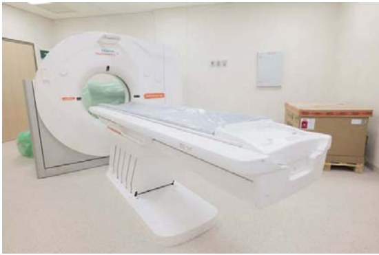
MERIDIANO | México

La Presidenta de México, Claudia Sheinbaum, reitera su compromiso con la salud de los mexicanos, al hacer la inversión en este equipo que será destinado a diversas instituciones del gobierno federal