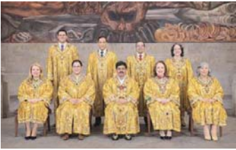
MERIDIANO | Ciudad de México

Durante su conferencia, la mandataria explicó que también fueron cancelados 59 de los 149 apoyos extraordinarios que existían anteriormente