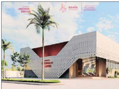
En San José del Valle