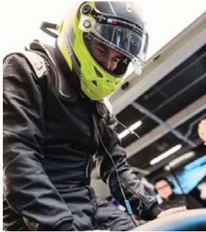
MERIDIANO | Deportes

De cara al debut de la escudería en la Fórmula 1, el piloto mexicano realiza una jornada de pruebas en el circuito de Silverstone