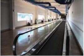
MERIDIANO | Puerto Vallarta

El destino es pionero en implementar prácticas y capacitación a la industria de hospitalidad para una auténtica inclusión