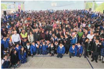
MERIDIANO | Ciudad de México

La Presidenta de México dejó en claro que nadie podrá quitarles la beca a los estudiantes de secundaria, al igual que la Pensión a los Adultos Mayores