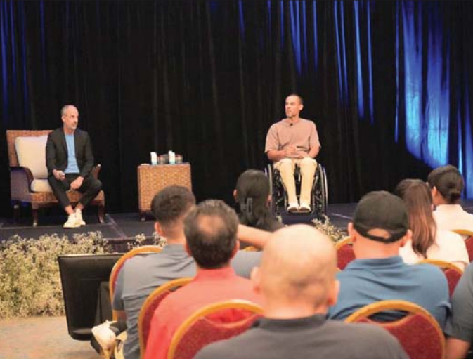
MERIDIANO | Puerto Vallarta

El destino es pionero en implementar prácticas y capacitación a la industria de hospitalidad para una auténtica inclusión