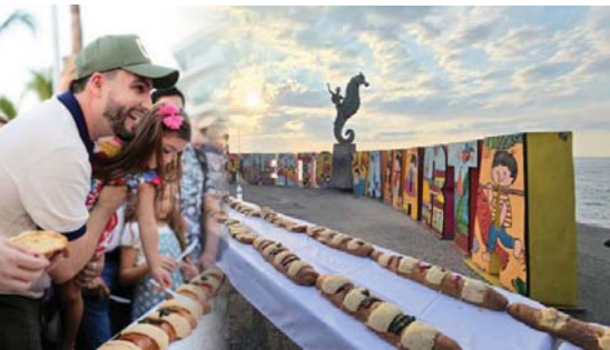
Ante más de 18 mil personas