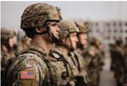
MERIDIANO | Estados Unidos

Un grupo de 75 legisladores de Estados Unidos manifestó su rechazo frontal a cualquier acción militar emprendida sin autorización del Congreso, tanto en Venezuela como en territorio mexicano.