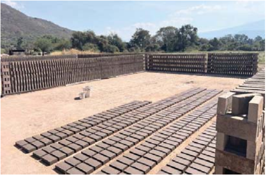
MERIDIANO | Jalisco

La PROEPA visitó distintos puntos del Área Metropolitana de Guadalajara