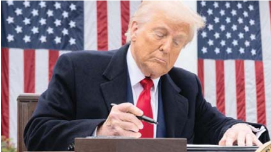
MERIDIANO | Estados Unidos

El presidente de Estados Unidos endureció su discurso y advirtió que organizaciones criminales ejercen un control significativo en México