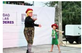
MERIDIANO | Puerto Vallarta