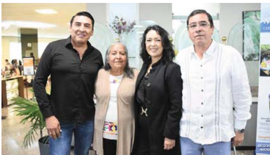
Ex alcaldes y ex diputados morenistas