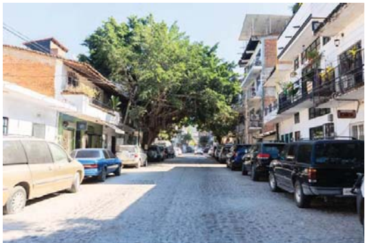
MERIDIANO | Puerto Vallarta

La obra en la calle Aquiles Serdán, en la colonia Emiliano Zapata reduce riesgos sanitarios y fortalece la infraestructura urbana en beneficio de habitantes, comercios y visitantes.