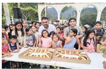
MERIDIANO Puerto Vallarta