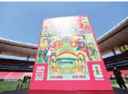
MERIDIANO | Jalisco

Este evento de talla global atraerá a decenas de miles de visitantes de distintas partes del mundo, lo que tendrá un impacto directo en la actividad turística del estado, especialmente en Puerto Vallarta