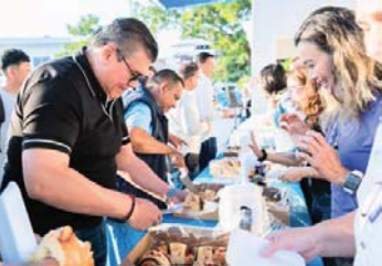
MERIDIANO | Puerto Vallarta

En un clima de sana convivencia, trabajadores y directivos de la Familia SEAPAL Vallarta comparten la tradicional Rosca por el Día de Reyes, con la motivación de iniciar un nuevo año para brindar mejores servicios a las familias vallartenses.