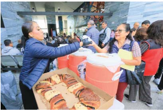
Ofrecen rosca y café

Con el cierre de este programa, el Instituto refrenda su compromiso de seguir trabajando en 2026 por una capacitación accesible, pertinente y con sentido social, que contribuya al bienestar de las personas y al fortalecimiento del tejido comunitario en todo el estado.