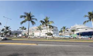
Panorama, Navigator of the Seas y MSC Magnifica, entre otras.

Puerto Vallarta iniciará el año 2026 con una intensa actividad turística por la llegada de 24 cruceros programados durante el mes de enero, de acuerdo con el calendario tentativo de arribos dado a conocer por autoridades portuarias.