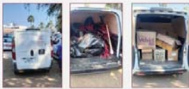
Entrega de artículos pirotécnicos para su destrucción.

El Gobierno Municipal de Bahía de Banderas reiteró su compromiso de continuar fortaleciendo las acciones de prevención y protección civil, trabajando de manera permanente para garantizar la seguridad y el bienestar de las familias del municipio.