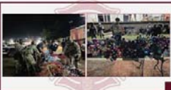
Protección Civil y Bomberos de Bahía de Banderas