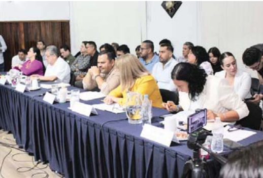
No más impunidad

Además, se les recuerda mantener limpio el frente de sus propiedades, contribuyendo así a preservar la imagen y limpieza de la Zona Romántica, uno de los principales atractivos turísticos de la ciudad, y haciendo de este un lugar agradable para todos.