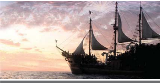
En CERESO de Bucerías