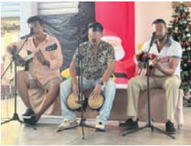
MERIDIANO | Bahía de Banderas

Durante la actividad, se entregaron constancias a seis personas privadas de la libertad, integrantes de la cuarta generación del programa, quienes estuvieron acompañadas de sus familiares