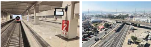
MERIDIANO | Ciudad de México

La Presidenta de México, Claudia Sheinbaum Pardo, anunció que en el primer trimestre de 2026 estará listo el tren de pasajeros Lechería-Aeropuerto Internacional Felipe Ángeles (AIFA), esto luego de realizar el primer recorrido por este nuevo sistema ferroviario.