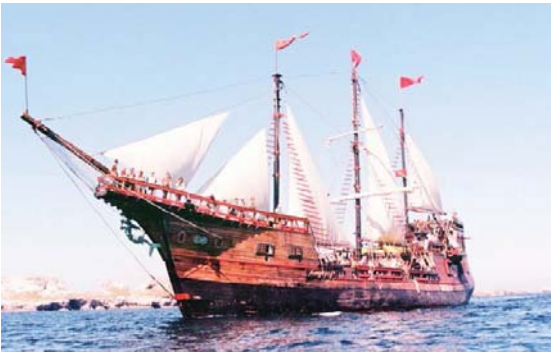
A Puerto Vallarta