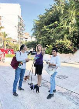
MERIDIANO | Puerto Vallarta

El Gobierno del Bien hace un llamado a los vecinos de la Zona Romántica a respetar los días y horarios de recolección de basura y así evitar sanciones.