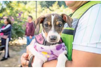
MERIDIANO | Puerto Vallarta

Las reformas contemplan la creación del Inspector de Bienestar Animal para atender denuncias y dar seguimiento a casos de maltrato