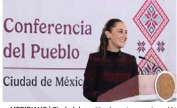
MERIDIANO | Ciudad de México

Inició la construcción de cuatro Centrales de Ciclo Combinado, tres Centrales Fotovoltaicas y tres proyectos de energías limpias