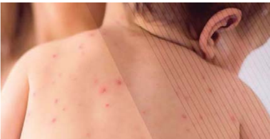
MERIDIANO | Bahía de Banderas

Las personas contagiadas se encuentran bajo resguardo y vigilancia médica, mientras se mantiene el monitoreo de contactos cercanos y la aplicación de cercos sanitarios en las zonas correspondientes