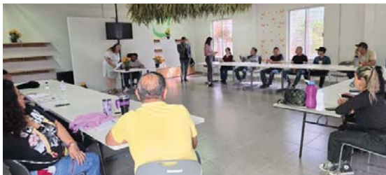
Imparte 39 cursos