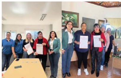
El IDEFT y DIF municipales

El alcalde también subrayó que su prioridad es seguir fortaleciendo la infraestructura básica, el agua potable, drenaje, así como las vialidades en las colonias y comunidades del municipio. “Hoy entregamos una avenida digna, segura y de calidad. Les pido que la cuiden, que la respeten y que hagamos equipo para seguir construyendo bienestar”, concluyó.