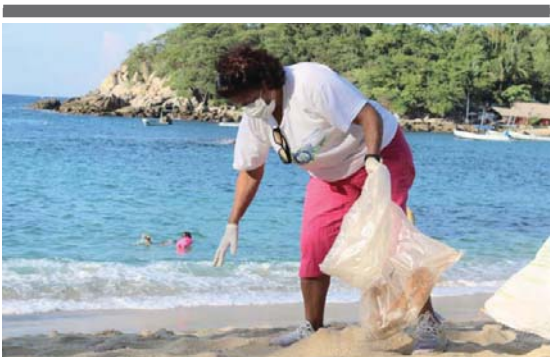
Ante llegada de turistas