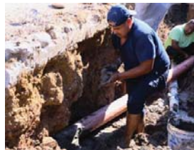
MERIDIANO | Puerto Vallarta

SEAPAL Vallarta realizó la reposición de una línea de agua potable en la calle Ecuador, entre Panamá y Uruguay, en la colonia 5 de Diciembre, con el propósito de mejorar la continuidad del suministro