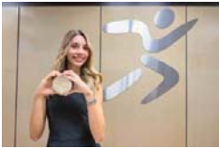
MERIDIANO | Deportes

Tras recibirlo por primera vez en 2018, la marchista vuelve a ser galardonada este año al conquistar el subcampeonato mundial en Tokio 2025