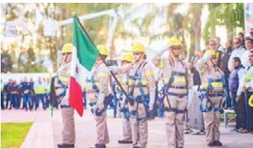
MERIDIANO | Ciudad de México

La CFE avanza hacia una distribución equitativa del poder técnico y estratégico en la empresa