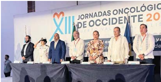
MERIDIANO | Puerto Vallarta

El encuentro fue para discutir los avances y estrategias en la atención oncológica en la región