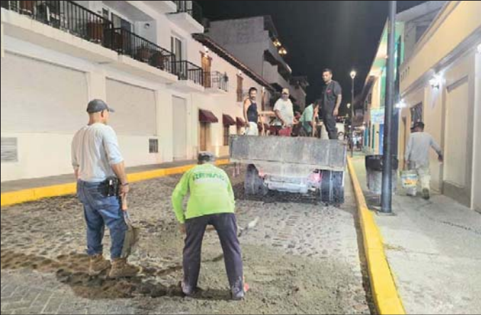
MERIDIANO | Puerto Vallarta

Las calles Morelos e Insurgentes fueron intervenidas gracias a la disponibilidad y compromiso de los trabajadores del Ayuntamiento quienes trabajan de manera nocturna para evitar aumentar el tráfico