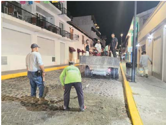
MERIDIANO | Puerto Vallarta

Las calles Morelos e Insurgentes fueron intervenidas gracias a la disponibilidad y compromiso de los trabajadores del Ayuntamiento quienes trabajan de manera nocturna para evitar aumentar el tráfico