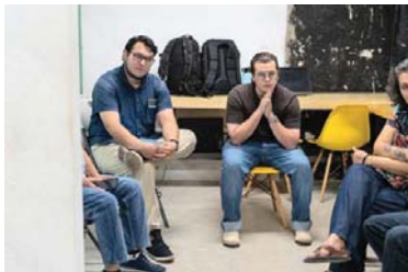
MERIDIANO | Puerto Vallarta

El gobierno municipal de Puerto Vallarta abrió un espacio de participación ciudadana que tendrá sesiones el 26 de noviembre, 10 y 17 de diciembre en el Centro Cultural del Pitillal